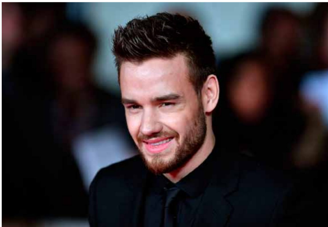
Misterio. Por la muerte del músico británico Liam Payne

La Policía Científica llevó a cabo una minuciosa inspección ocular en el lugar donde se encontró el cuerpo del músico británico Liam Payne, el exintegrante de One Direction que falleció en Buenos Aires, durante la tarde del miércoles, al caer de un tercer piso del hotel CasaSur de Palermo.