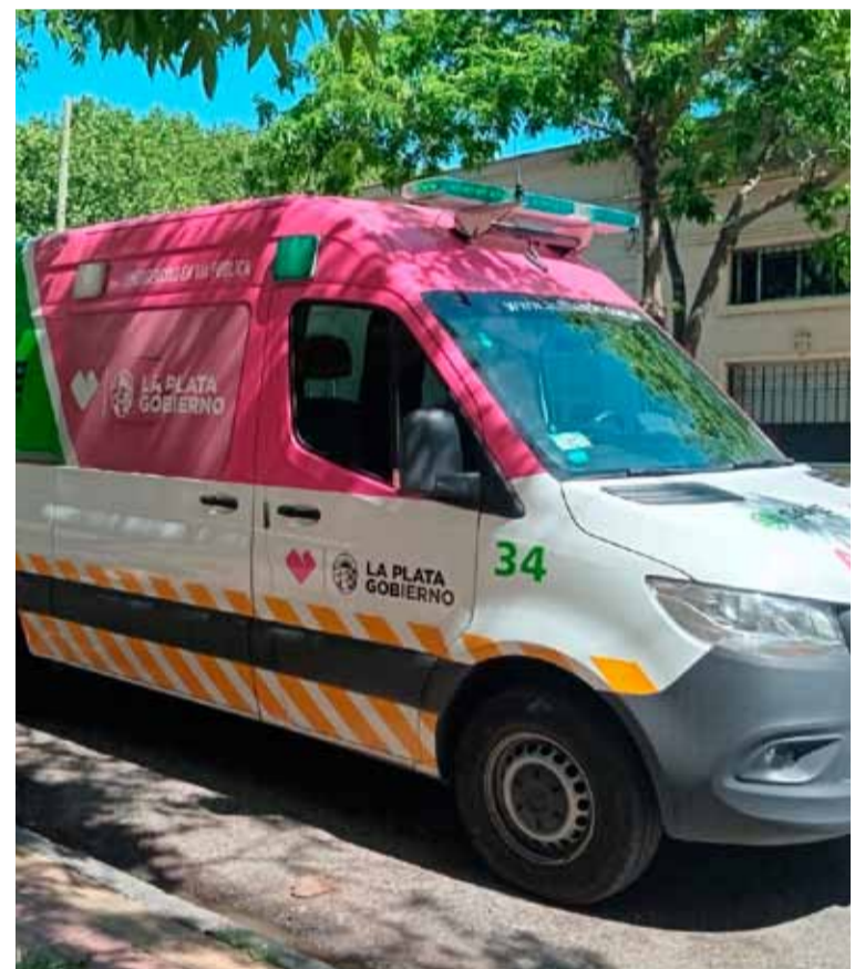
Tragedia. El fatal episodio vial ocurrió en el barrio de Villa Elvira, en La Plata

La causa recayó en la Unidad Fiscal de Instrucción (UFI) de turno, que la calificó como “homicidio culposo”. Por el momento, ambos conductores están imputados. (DIB)