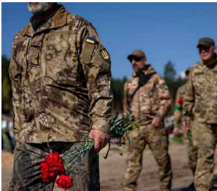
Avance. De las tropas rusas en el frente

Primero, un centenar de hombres encapuchados irrumpió en la catedral del Arcángel Miguel de la canónica Iglesia ortodoxa ucraniana en la ciudad de Cherkasi durante la liturgia, abrió fuego contra los feligreses y utilizó sprays de pimienta. Luego, tras un segundo asalto, esos hombres