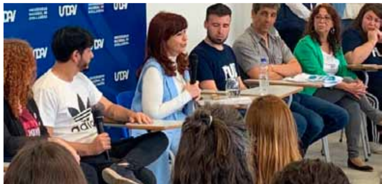
Sorpresiva visita de CFK a la Universidad de Avellaneda

La expresidenta Cristina Fernández de Kirchner visitó este jueves a los estudiantes, graduados, docentes y no docentes de la Universidad Nacional de Avellaneda, en medio de la tensión que existe con el sector educativo por el recorte de fondos que lleva adelante el Gobierno de Javier Milei.