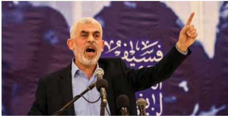
Abatido. El extremista islámico Hamás, Yahya Sinwar

“Israel necesita su apoyo y asistencia ahora más que nunca para avanzar juntos hacia estos importantes objetivos”, concluyó Katz.