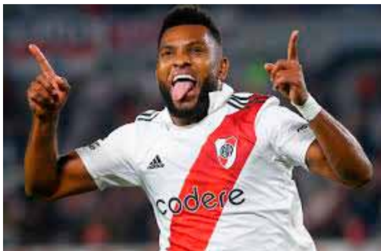
Borja buscará reencontrarse con el gol

Riestra recibirá a Atlético Tucumán este viernes, desde las 15