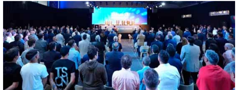
La asamblea aprobó la reelección de Chiqui Tapia y quitar los descensos

Claudio Tapia recordó lo que se vivió en AFA hace unos años: "Celebramos cada vez que tenemos la posibilidad de elegir democráticamente a los dirigentes que van a representar al fútbol argentino. Lo digo con mucha firmeza: quienes comenzaron en el 2017 saben de qué hablamos, nos tocó una difícil situación. Refundamos el fútbol argentino".