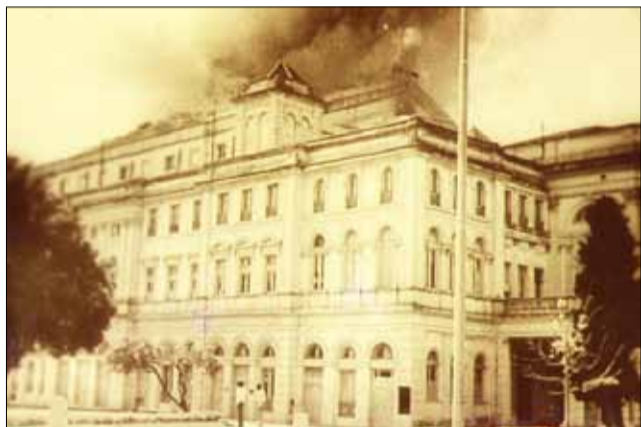
Incendio en el Teatro Argentino de La Plata.

1801 - nace Justo José de Urquiza, político y militar argentino. 1862 - Bartolomé Mitre nombra la primera Corte Suprema de Justicia argentina. 1867 - Se concreta la compra de Alaska por parte de Estados Unidos a Rusia. A diferencia de los territorios conquistados a México, el estado más septentrional se convierte en territorio norteamericano por una operación inmobiliaria de 7,2 millones de dólares. El dato de color lo da el hecho de que Alaska se regía por el calendario juliano, a diferencia del calendario gregoriano utilizado en Occidente. Con lo cual deja de ser territorio ruso el 6 de octubre de 1867 de acuerdo al calendario que rige en Rusia mientras ese mismo día es 18 de octubre en el país del que empieza a formar parte. 1869 - aparece en Buenos Aires el diario "La Prensa". 1872 - se funda la ciudad de Posadas (provincia de Misiones, Argentina). 1882 - se crea el Observatorio Astronómico de La Plata, en Argentina. 1898 - se iza en San Juan de Puerto Rico la bandera de los Estados Unidos, una vez perdida la isla para España. 1931 - muere Thomas Alva Edison, inventor estadounidense. 1947 - nace Antonio Tarragó Ros, músico argentino. 1949 - más de un millar de muertos y unos 100.000 damnificados en Guatemala, tras dos