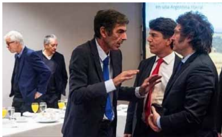
Rodríguez Chirillo se alejó del cargo

El Gobierno nacional anunció este jueves la renuncia de Eduardo Rodríguez Chirillo a la Secretaría de Energía de la Nación “por problemas de salud”, y en su lugar asumirá la dirigente del PRO, María Tettamanti, recomendada por Mauricio Macri.