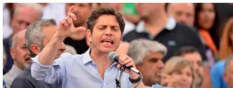
Axel Kicillof recordó el 17 de Octubre con un acto en Berisso

Después de agradecer a las organizaciones sociales, sindicalistas, intendentes (“decenas”), estudiantes, jubilados, Madres y Abuelas de Plaza de Mayo, Kicillof se preguntó: “¿Qué se conmemora hoy?”. E introdujo diciendo que “un 17 de octubre recuperamos la