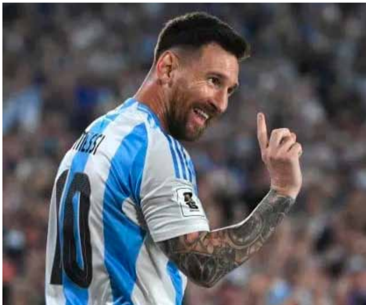
Messi y el futuro con la selección

Consultado sobre si se ilusiona con jugar el próximo Mundial 2026, Messi no gambeteó la pregunta pero volvió a repetir la misma frase de siempre: "Siempre dije que las cosas pasan por algo y nunca me adelanto a los acontecimientos. Vivo el día a día y cuando llegue el momento de decidir si puedo estar en el próximo Mundial, se verá. Ojalá pueda seguir rindiendo a este nivel así puedo seguir siendo feliz. No me pongo como objetivo el llegar, sino el estar bien".